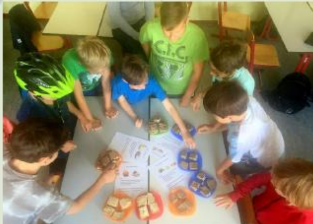
Auf dem Programm steht auch ein Besuch in der Klostermühle Boitzenburg.